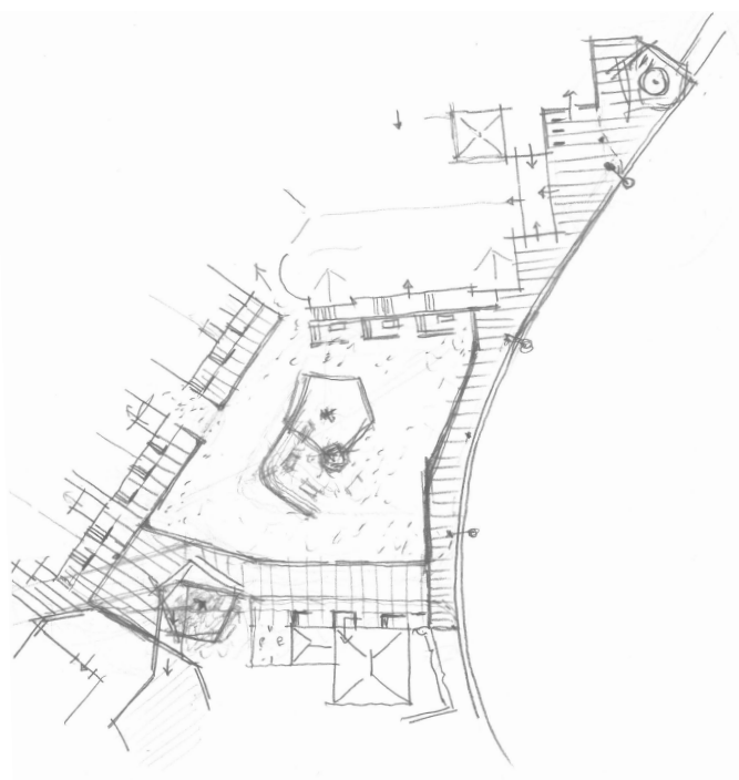
Konzeptskizze Dorfplatz, M 1:1000