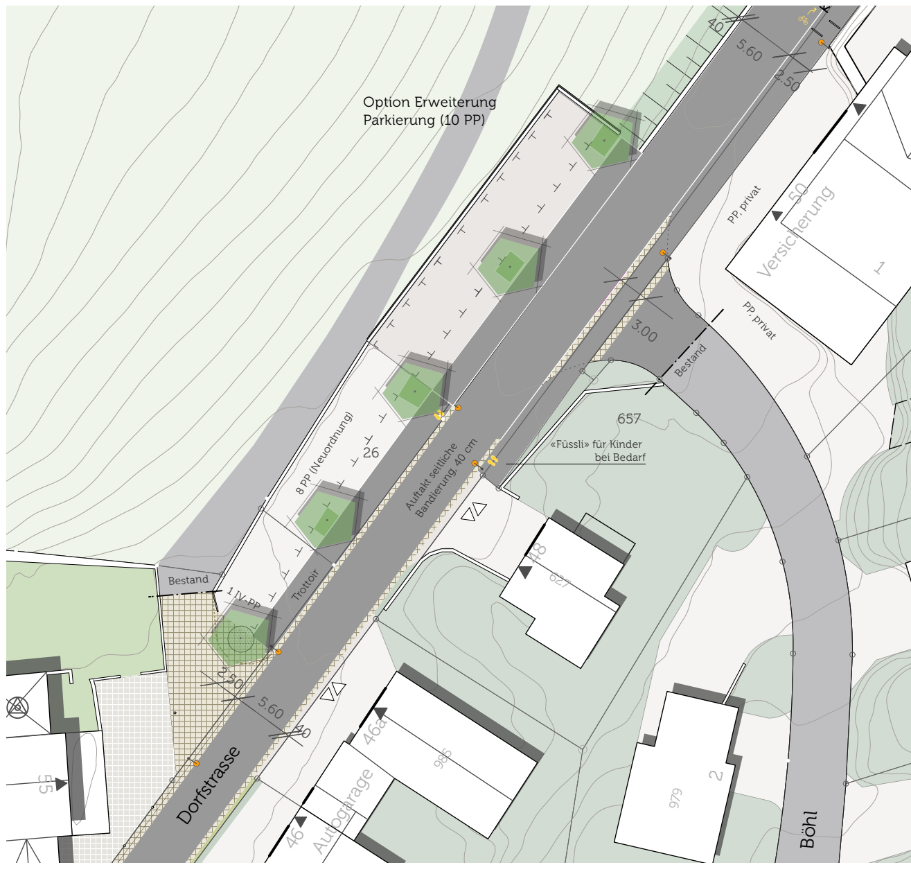
Parkplatz Kirche, Erweiterungsmöglichkeit nach Norden